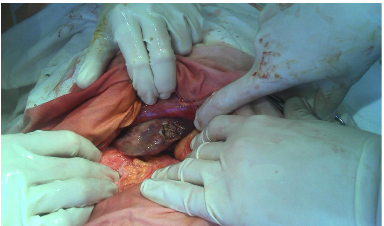
Рис 2. Кровотечение остановлено препаратом «Гемоблок»